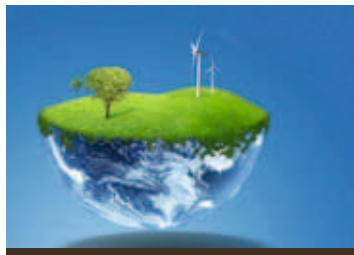
ΑΝΑΝΕΩΣΙΜΕΣ ΠΗΓΕΣ ΕΝΕΡΓΕΙΑΣ ΣΕΛ 5

Η ΕΞΕΛΙΞΗ ΤΗΣ ΜΟΥΣΙΚΗΣ ΣΕΛ 2 | Η ΧΡΗΣΙΜΟΤΗΤΑ ΤΟΥ INTERNET ΣΤΑ ΣΧΟΛΕΙΑ ΚΑΙ ΤΑ ΠΑΝΕΠΙΣΤΗΜΙΑ ΣΕΛ 4 | ΤΑ ΣΧΟΛΕΙΑ ΣΤΗ ΣΗΜΕΡΙΝΗ ΕΠΟΧΗ ΣΕΛ 4 | ΟΙΚΟΝΟΜΙΚΗ ΚΡΙΣΗ ΣΕΛ 6 | ΡΥΖΟΓΑΛΟ ΣΕΛ 6 | ΑΠΟ ΤΟ ΠΕΡΙΣΤΕΡΙ ΣΤΟ E-MAIL ΣΕΛ 7 | ΤΟ ΤΕΛΟΣ ΤΩΝ ΔΙΑΚΟΠΩΝ ΣΕΛ 7 | ΠΕΡΙ ΠΑΤΡΙΩΤΙΣΜΟΥ ΣΕΛ 7 | ΣΤΑΥΡΟΛΕΙΟ ΣΕΛ 8