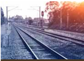
Σιδηροδρομικό Δίκτυο | σελ 3